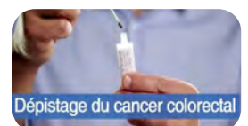
Dépistage du cancer colorectal

TRAITEMENT ET VIE pendant et après le cancer : conseils des oncologues, des équipes soignantes en oncologie de la Polyclinique et de l'AACCC